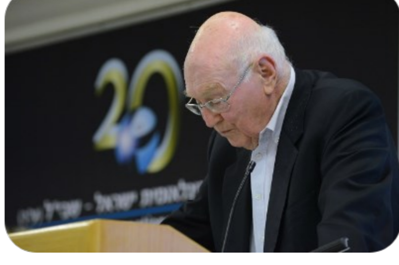
מדברי שופט בית המשפט העליון לשעבר יצחק זמיר:

"אפתח בשבח האכסניה, היא העמותה לשקיפות בינלאומית, שקיבלה על עצמה לענות על צורך חשוב בישראל, הוא הצורך בשקיפות, בראש ובראשונה שקיפות בשירות הציבורי, צורך שחשיבותו רק גדלה והולכת. צורך זה בא לידי ביטוי בוטל גם בתקופה האחרונה, נוכח הפרשות שהמטרה חקרה, והיועץ המשפטי לממשלה בודק, בחשד לביצוע עבירות פליליות בצמרת השלטון בישראל. הייתה נמתנת שהתנהגות של אנשי שלטון, שפוגעת בטוהר המידות ובאמון הציבור, הייתה נמתנת אילו הייתה שקופה, והם היו יודעים שהיא שקופה, כפי שנדרש. מצב הקיים חשוב לזכור ולהכיר את האמירה הקולעת של השופט האמריקאי ברנדיס שאמר כך: "אור השמש הוא המטרה הטוב ביותר, ואור המנורה הוא השוטר היעיל ביותר". אפשר לומר, במלים אחרות, השקיפות היא החיסון נגד השחיתות..."